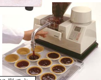
写真は PV-4002 型です